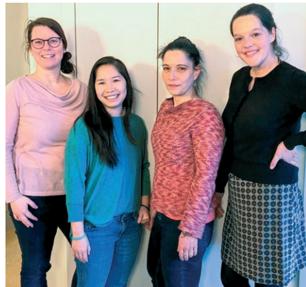
Der Vorstand des Fördervereins der Kita Kreuz und Quer e.V.

Kita. Bereits im Gründungsjahr wurde zusammen mit dem Kita-Team das Sommerfest gestaltet und der Sankt Martinstag in der Kreuzkirche gefeiert. Die finanziellen Mittel werden durch Mitgliedschaften, Spenden, Sponsoring und auch eigene Veranstaltungen und Aktionen des Fördervereins gesammelt. Im November fand zu diesem Zweck der erste Kinderkleidermarkt des Fördervereins der Kita Kreuz und Quer e.V. in der Kreuzkirche statt, welcher großen Anklang gefunden hat. Ein weiterer ist für das Frühjahr 2024 geplant.