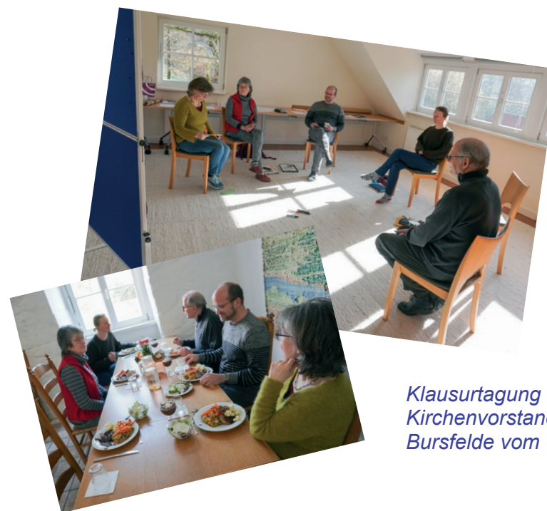
Klausurtagung vom Kirchenvorstand im Kloster Bursfelde vom 11.–13.2022