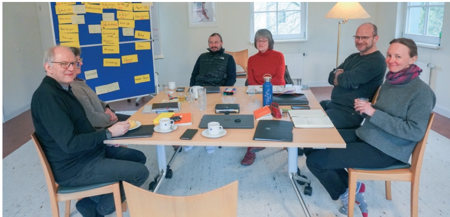
Sitzung des aktuellen Kirchenvorstandes im April 2023

Unsere Bitte also: Denken Sie darüber nach, ob Sie jemanden kennen, der für dieses Amt in Frage kommt. Sprechen Sie mit Familie, Freunden und Nachbarn darüber. Können Sie sich selbst eine Mitarbeit im KV vorstellen? Wenn Sie jemanden vorschlagen möchten (auch sich selbst) oder noch Fragen dazu haben: Auf der letzten Seite finden Sie Ansprechpartner.